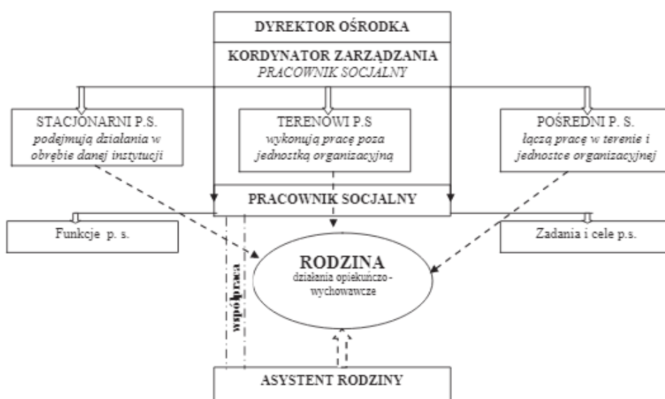
Schemat 1. Struktura organizacyjna przy współdziałaniu pracownika socjalnego i asystenta 5 .

Zgodnie z ustawą o wspieraniu rodziny i systemie pieczy zastępczej rodzinie przeżywającej trudności w wypełnianiu funkcji opiekuńczo-wychowawczych miasto Opole zapewnia wsparcie, które prowadzone jest w formie pracy z rodziną, pomocy w opiece i wychowaniu dziecka w działaniach profilaktycznych poprzez pracę asystentów rodziny i w układzie substytuującym środowisko rodzinne, zapewniając bezpieczne miejsce w pieczy zastępczej. W realizacji zadań w zakresie wspierania rodziny miasto Opole przede wszystkim kładzie nacisk na wzmocnienie działań profilaktycznych i doskonalenie metod pracy z rodziną na rzecz pozostawienia w niej dziecka lub powrotu do niej dziecka oraz stworzenie systemu wsparcia rodziny, która przeżywa trudności w wypełnianiu funkcji opiekuńczo-wychowawczej wobec swoich dzieci. Poniższy schemat przedstawia strukturę organizacji pracy przy współdziałaniu pracownika socjalnego i asystenta rodziny.